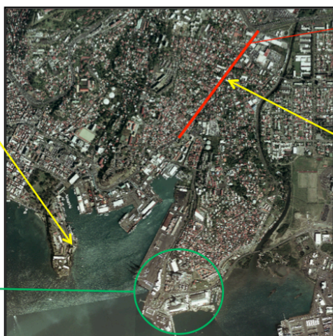
Axe routier de trafic dense